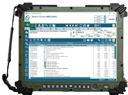
Devis sur CodialEveryWhere